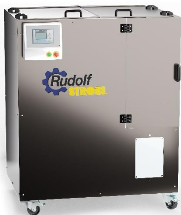
STROBBER WAB 250