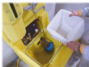
Filtersystem, Tauchpumpe und Hochdruckpumpe