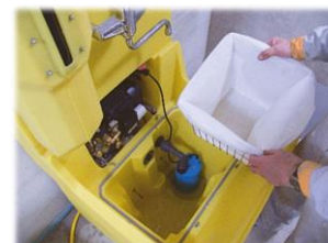
Filtersystem, Tauchpumpe und Hochdruckpumpe