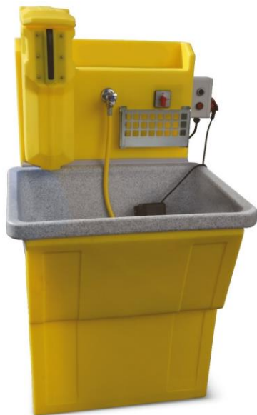
STROBER WAB-IG (Werkzeug-Waschsystem STROBER WAW nicht im Lieferumfang)