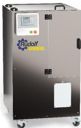
STROBBER WAB 125