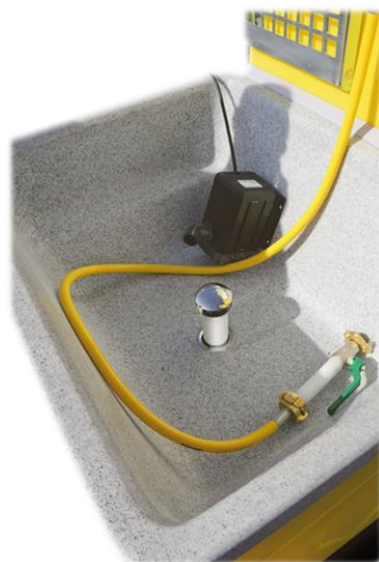
Umwälzpumpe und Push-Open-Ventil