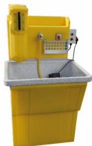
STROBBER WAW 800-B