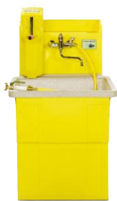
STROBBER WAW 800