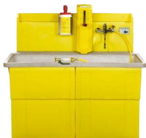
STROBBER WAW 1500