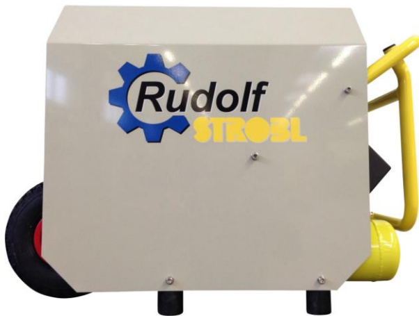
Kompressor STROCOMP 865